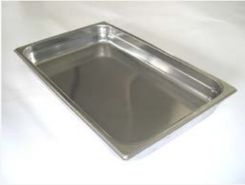
GN 1/1 150 mm tiefe Behälter