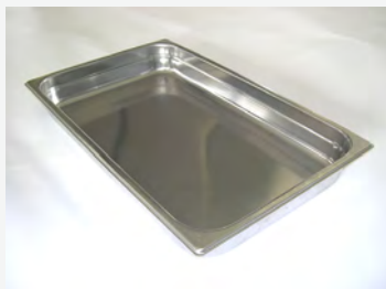
GN 1/1 150 mm tiefe Behälter